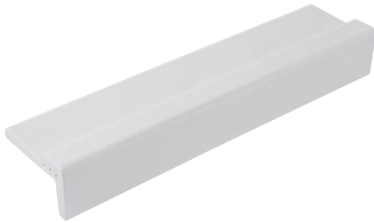
294 mm lang 294 mm long