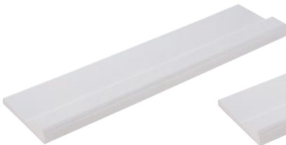
294 mm lang 294 mm long