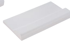
144 mm lang 144 mm long