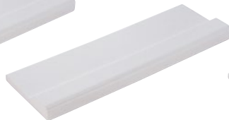
220 mm lang 220 mm long